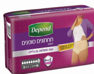
תחתונים סופגים בעלי גזרה גבוהה לנשים, מידה S