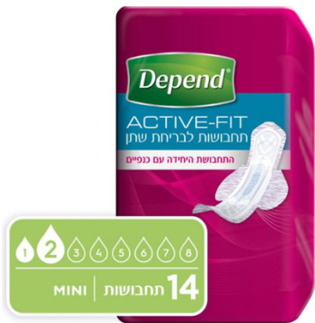
תחבושות Active-Fit לבריחת שתן, מיני

אם בחרתם בתחבושות, יש את סדרת התחבושות בעלת טכנולוגיית Flex שנועלת את הנוזלים במהירות ומגנה עליכם מפני דליפה, מונעת ריחות וסופגות במהירות כך שתרגישו תמיד נינוחים. תחבושות עבור נשים: