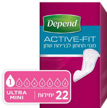
מגן תחתון Active-Fit לבריחת שתן

עבור בריחת שתן קלה אנו ממליצים על שימוש במגיני תחתון או בתחבושות ייעודיות לבריחת שתן. סדרת מגיני התחתון עבור נשים: