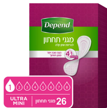
מגני תחתון לנשים לבריחת שתן קלה