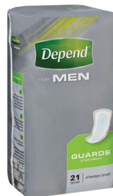
תחבושות לבריחת שתן לגברים