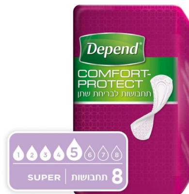
תחבושות Comfort-Protect לבריחת שתן, סופר