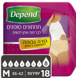
תחתונים סופגים בעלי גזרה גבוהה לנשים, מידה M