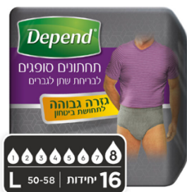
תחתונים סופגים בעלי גזרה גבוהה לגברים, מידה L