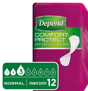
תחבושות לבריחת שתן Comfort - Protect Normal, רמת ספיגה רגילה לנשים