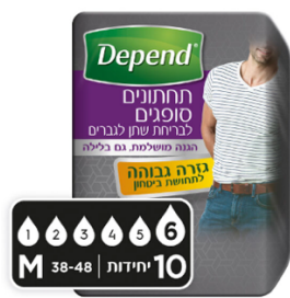
תחתונים סופגים בעלי גזרה גבוהה לגברים, מידה M