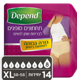
תחתונים סופגים בעלי גזרה גבוהה לנשים, מידה XL