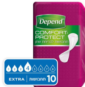
תחבושות Comfort-Protect לבריחת שתן, אקסטר