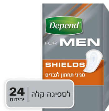
מגני תחתון לבריחת שתן לגברים