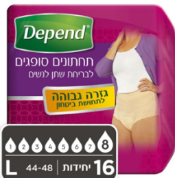
תחתונים סופגים בעלי גזרה גבוהה לנשים, מידה L