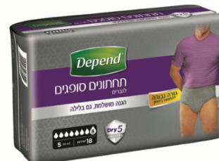
תחתונים סופגים בעלי גזרה גבוהה לגברים, מידה S