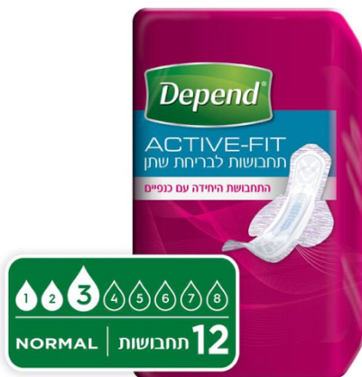
תחבושות Active-Fit לבריחת שתן, נורמל