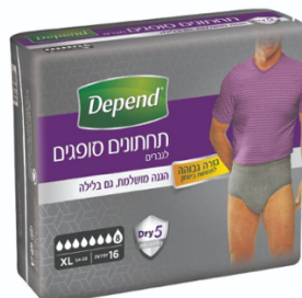
תחתונים סופגים בעלי גזרה גבוהה לגברים, מידה XL