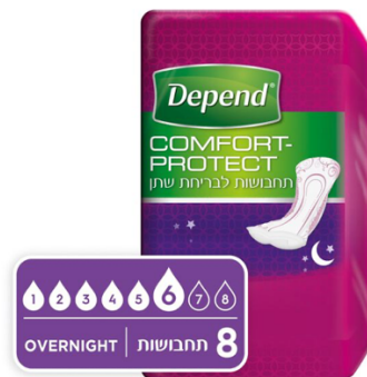
תחבושות לבריחת שתן Comfort-Protect

חשוב לציין שכאשר השימוש הוא לזמן ארוך יחסית, כמו שימוש לאורך לילה שלם, תוכלו לבחור להשתמש במוצר המותאם ללילה שרמת הספיגה שלו גבוהה יותר והוא מספק תחושה נוחה ובטוחה למשך זמן ארוך יותר.